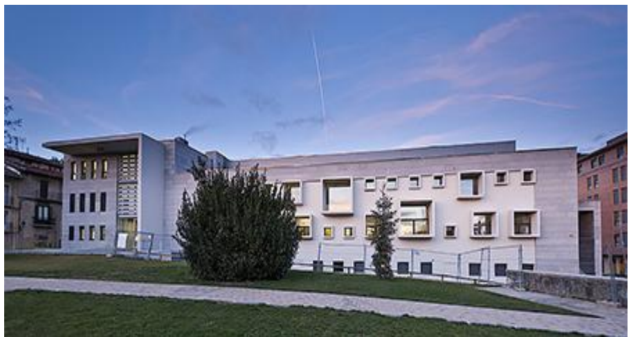
La Casa de Cultura-Kultur Etxea, inaugurada en la primavera de 2011.

El pasado 25 de marzo se cumplían cinco años de la que ha resultado ser una obra emblemática para Villava-Atarrabia, la nueva Casa de Cultura-Kultur Etxea. El nuevo edificio, fruto de un plan financiero ejemplar, ha servido para cohesionar socialmente al pueblo y para fortalecer una actividad cultural ya de por sí intensa.