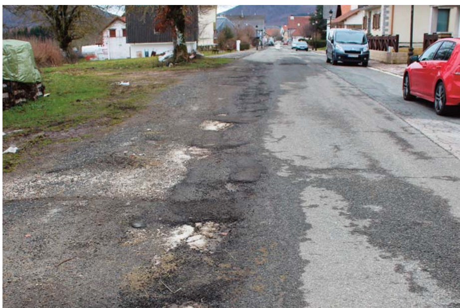
Aspecto actual de la calle Roncesvalles, que va a renovarse este año.