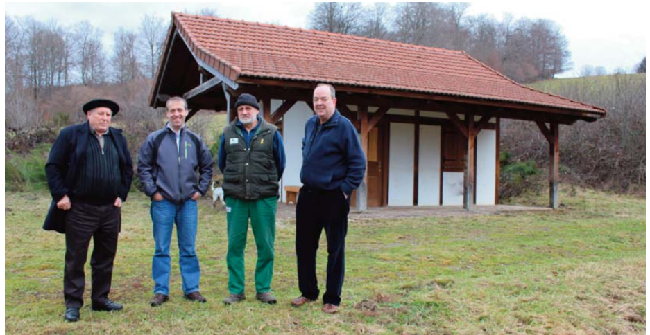
Cuatro de los siete concejales, junto a la caseta del Parque de Aventuras.

Este proyecto busca sensibilizar y concienciar sobre la guerra, tanto sobre la Guerra Civil española, como sobre la II Guerra Mundial. Al tratarse de una zona transfronteriza, el peso