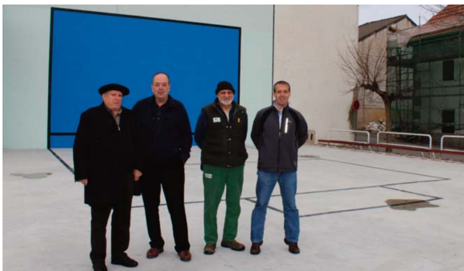
Auritzen Geroa Bairen zazpi zinegotzietako lau, front-ball berriaren ondoan.