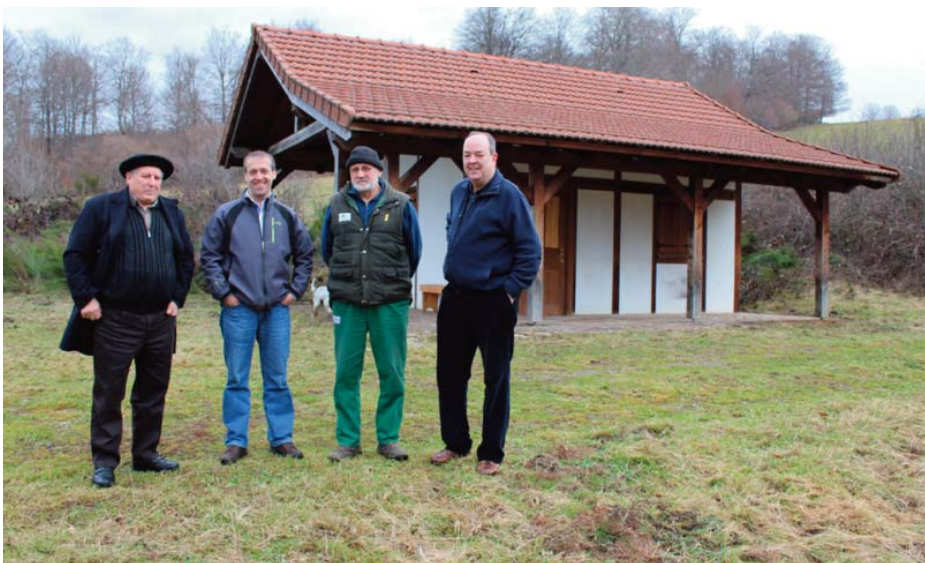
Zazpi zinegotzietako lau, Abentura Parkeko etxetxoaren ondoan.

Proiektu honek gerrari buruz sentsibilizatzea eta kontzientziatzea du helburu, bai Gerra Zibilari buruz bai eta II Mundu Gerrari buruz ere. Mugakidea den eskualde bat denez, gatazka armatuen zama beti izan da beste tokietan baino garrantzitsuagoa. Zentzu honetan, 'P Linea' Oroimen Historikoaren Legearen baitan toki sinboliko mo-