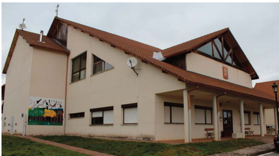
Imagen de la Casa de Cultura, que se ha habilitado para las oficinas de la Mancomunidad de Servicios Sociales, arreglando goteras e instalando calefacción.

El importe asciende a 155.000€ de los que 110.000€ correrán a cargo del Gobierno de Navarra. El proyecto se completa con la urbanización del paseo hasta el cementerio.