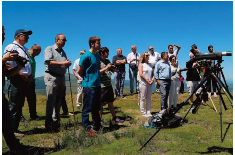
Visita a Lindus.

tamento de Medio Ambiente del Gobierno de Navarra la restauración del cauce de la regata Xuringoa mediante una solución de bioingeniería, en concreto la construcción de un "muro Krammer" de contención de las avenidas de agua. Gracias a las gestiones la obra, de unos 12.000€ se ha ejecutado con cargo a dicho departamento, asumiendo el Ayuntamiento únicamente el coste de la redacción del proyecto, unos 1.200 euros, que elaboró la empresa del Valle de Erro "Trilumak".